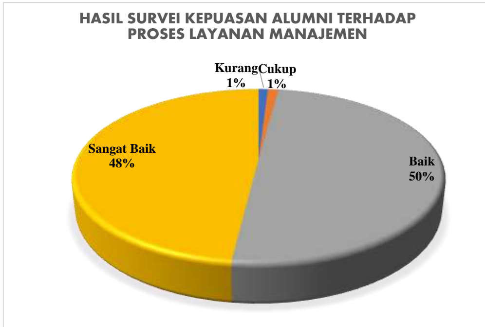
Diagram 4.1 Persentase Hasil Survei Kepuasan Alumni terhadap Proses Layanan Manajemen pada Program Studi Manajemen

Berdasarkan hasil survei dapat dilihat pada Diagram 4.1 yang menggambarkan bahwa secara keseluruhan mahasiswa program studi Manajemen memberikan nilai Sangat Baik sejumlah 48%, nilai Baik sejumlah 50%, nilai Cukup sejumlah 1%, nilai kurang 1%. Jika merujuk pada Tabel 2.3 nilai persentase tersebut berada pada rentang 41-60%, sehingga dapat disimpulkan bahwa kepuasan alumni terhadap proses layanan manajemen di program studi Manajemen masuk pada kategori CUKUP BAIK .